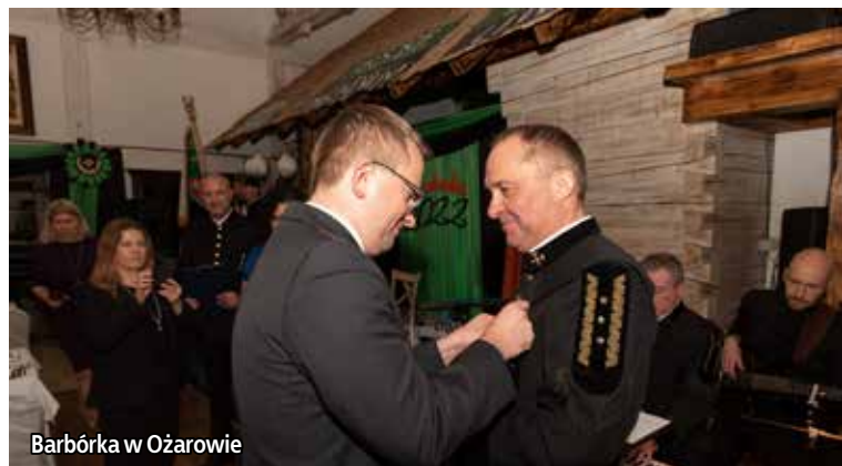
Barbórka w Ożarowie