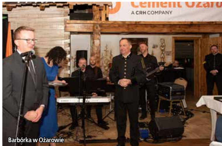
Barbórka w Ożarowie