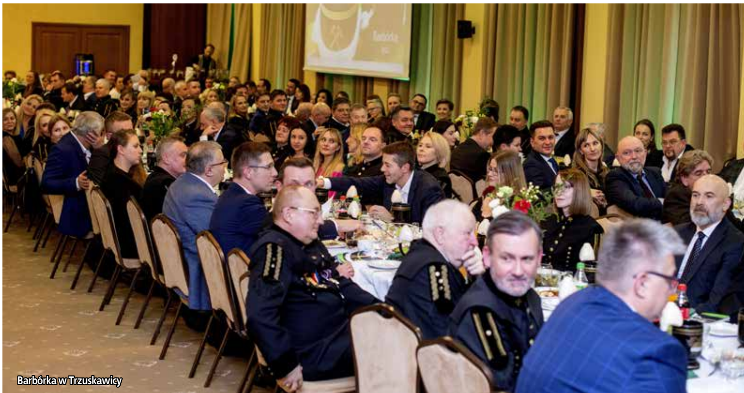
Barbórka w Trzuskawicy

Jak to zostało opisane w okolicznościowym śpiewniku przygotowanym przez firmę Trzuskawica S.A. - Karczma Piwna jest tradycyjną kontynuacją zwyczajów i obrzędów, którym hołdowali i hołdują górnicy. Spotkanie Gwarków jest tradycją, nawiązującą do spotkań górników, którzy po ciężkiej i znoej pracy gromadzili się, by przy kuflu piwa szukać wytchnienia w niefrasobliwości, a nawet frywolnym dialogu, kraszonym pieśnią.