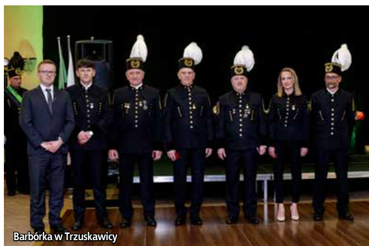
Barbórka w Trzuskawicy

I tak było również na obu Karczmach Piwnych, gdzie obok pracowników przyśpiewki górnicze gromko śpiewali przedstawiciele kierownictwa obu firm oraz zaproszeni goście.