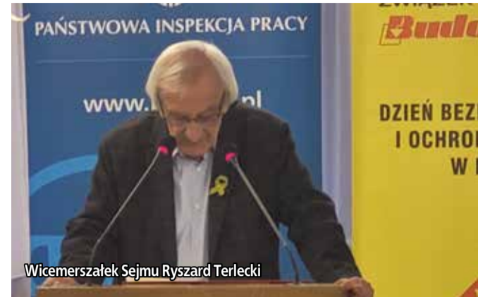
Wicemarszałek Sejmu Ryszard Terlecki