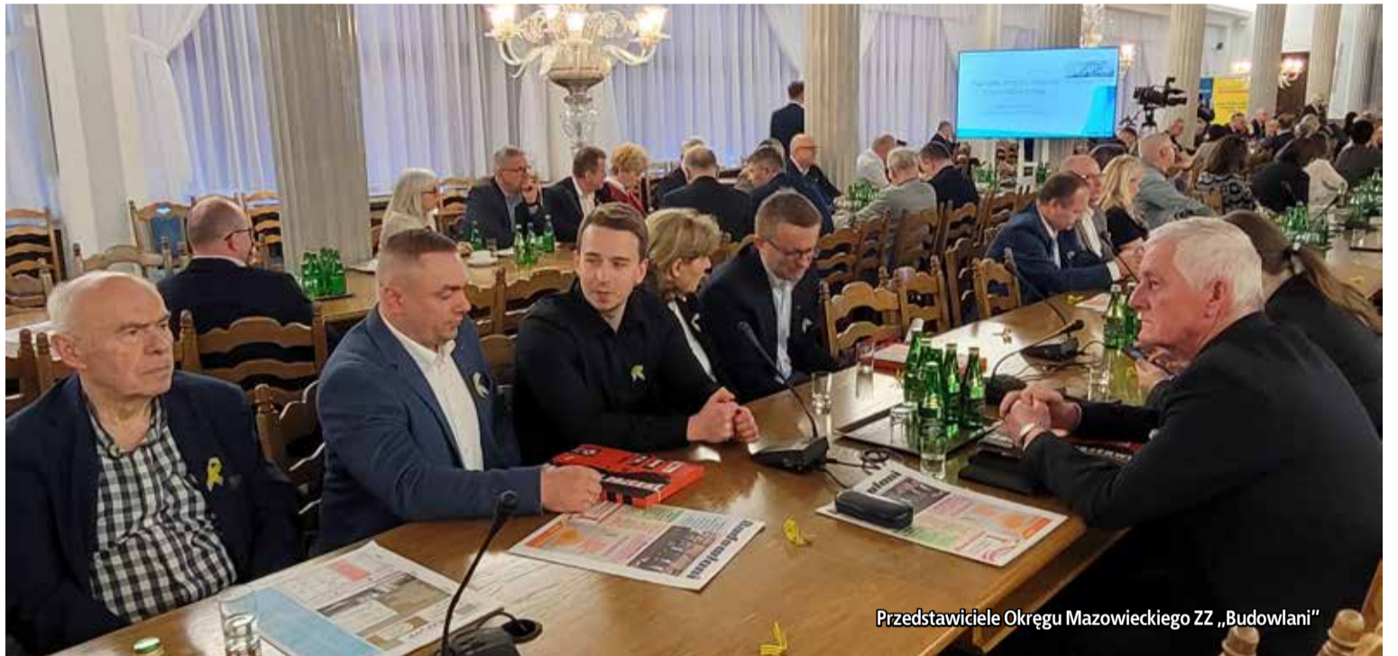
Przedstawiciele Okręgu Mazowieckiego ZZ „Budowlani”

Marlena Małąg, minister rodziny i polityki społecznej, dokonała oceny aktualnej sytuacji oraz nowych wyzwań w ochronie pracy. W 2022 roku ponad 66 tysięcy osób ucierpiało w wypadkach przy pracy. Wskaźnik wypadkowości wyniósł 4,66 na 1000 zatrudnionych. Dla porównania w 2015 roku poszkodowanych w wypadkach było ponad 87 tysięcy osób. Wskaźnik wypadkowości wynosił 7,24 na 1000 zatrudnionych. Tak znaczny spadek wskaźnika wypadkowości jest efektem działań środowisk pracowniczych wspieranych przez instytucje rządowe oraz organy nadzoru i kontroli, a także szczególnego wkładu nauki.