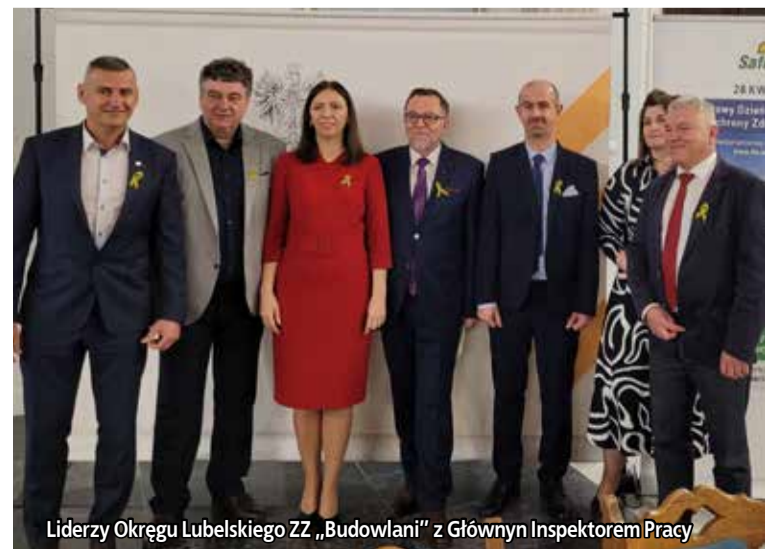
Liderzy Okręgu Lubelskiego ZZ „Budowlani” z Głównym Inspektorem Pracy

Dniem Bezpieczeństwa i Ochrony Zdrowia w Pracy oraz od wejścia w życie ustawy z dnia 30 października 2002 r. o ubezpieczeniu społecznym z tytułu wypadków przy pracy oraz chorób zawodowych. Na przestrzeni tych dwóch dekad warunki pracy w Polsce znaczą-