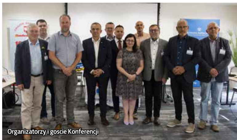
Organizatorzy i goście Konferencji

krajów przyjmujących największą liczbę pracowników delegowanych z krajów trzecich w budownictwie. (...) Od 24 lutego znajdujemy się jednocześnie w innej rzeczywistości w obszarze polityki, gospodarki i rynku