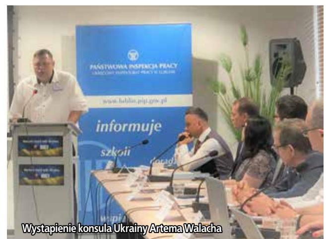
Wystąpienie konsula Ukrainy Artema Walacha